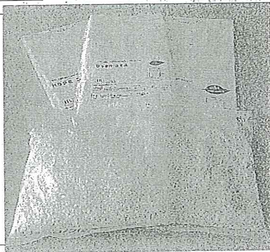
CO 2 削減効果の見込める特殊材料と商品化したゴミ袋

「木耕づくり」を体験し、同事務所の取引先、一般77人が参加した。テーマは「時代の先