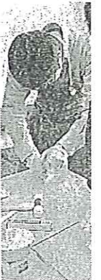
木耕つくり学生たち